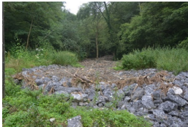
Blocs de grès

Les tas composés quasi uniquement de matériaux pierreux