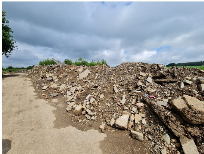
Terres stockées issues de différents lieux d'une commune

Terres provenant de différentes origines